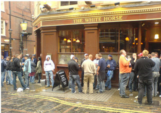
Deutsche Fans nehmen das "White Horse" ein- darunter auch zahlreiche Lautrer