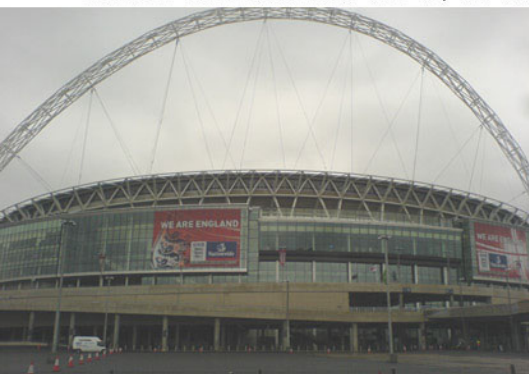
Das "New Wembley" in seiner Außenansicht